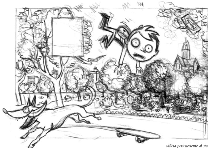
viñeta perteneciente al story

Cada historia tendrá un cierto carácter didáctico, relacionado con el aprendizaje de la lectura, los números, etc., pero evitando siempre caer en lugares comunes y jugando con algún que otro toque subversivo, que en el caso de El misterio de las cacaletras viene dado por las divertidas connotaciones escatológicas de la narración.