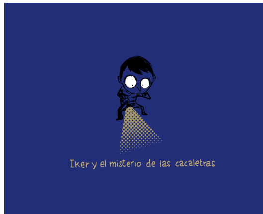
Portada en cartulina italiana, serigrafía y stamping