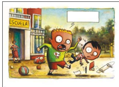
ejemplos de viñetas_color